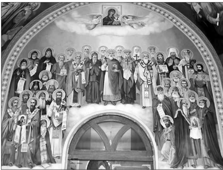
Собор Волинських святих

Преподобномученик Макарій, за переказами, передбачив лиха, які спіткають Канівський